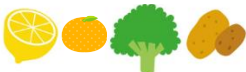
フルーツ・ブロッコリー・芋類など

ウイルスや細菌から体を守ります。体内に溜めておくことができないので、毎日の食事にビタミンCを取り入れましょう。